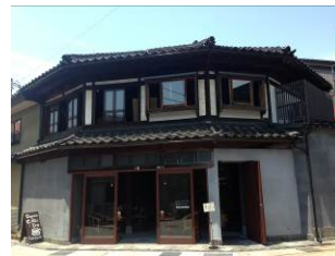
cafe uchikawa 六角堂