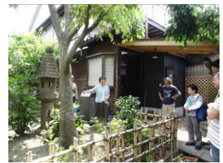
内川カフェの先駆者「茶処DO・U・ZO」さん