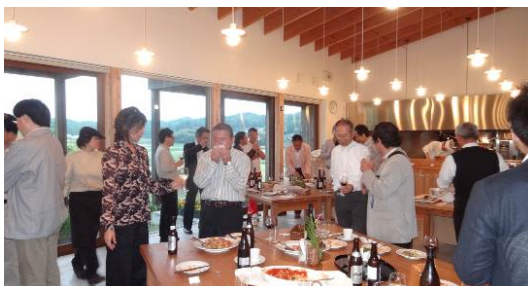
食育レストラン「きっちん里山倶楽部」での懇親会の様子

懇親会では、朝採れの野菜をふんだんに使用した美味しいお料理とワインに舌鼓を打ち、大いに盛り上がりました。