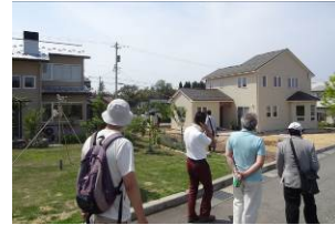
田園住宅開ヶ丘（全体面積 約2.7ha、区画数 27区画）