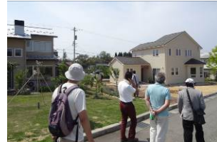
田園住宅開ヶ丘（全体面積 約2.7ha、区画数 27区画）