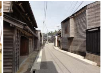
南側の集落の町並み