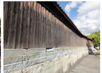
屋敷を囲う笏谷石と船板の塀