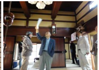
天井の高いチャノマ