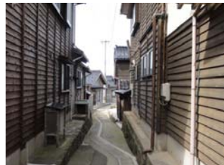
海岸に通じる細い路地