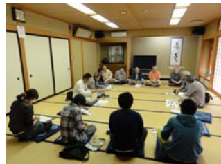
公民館での意見交換

[見学コース：旧嘉門家跡～角海家～北潟家（内部見学）～七野家（内部見学）～北前船資料館]